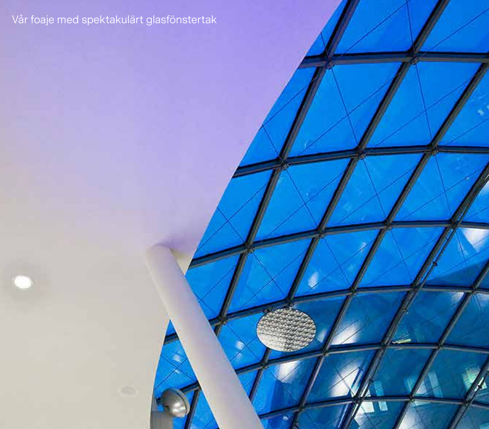
Vår foaje med spektakulärt glasfönstertak