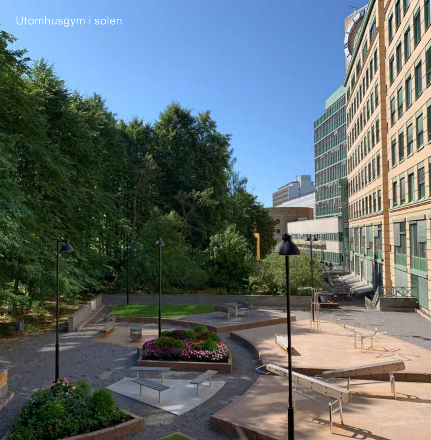
Utomhusgym i solen