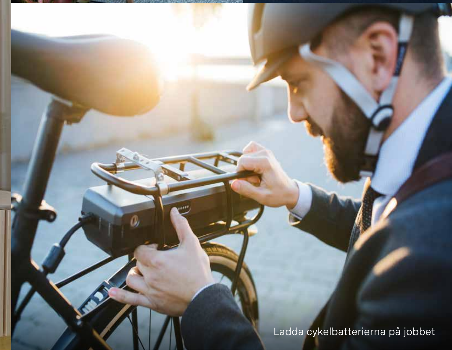
Ladda cykelbatterierna på jobbet