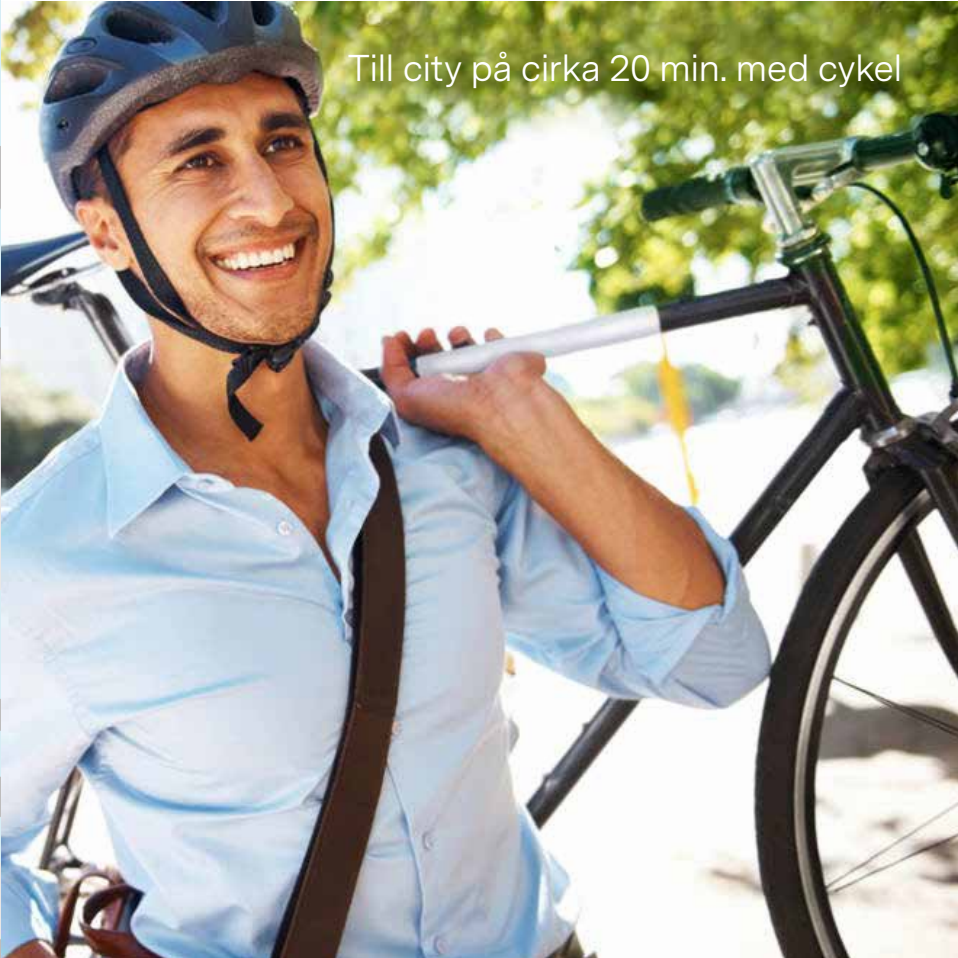
Till city på cirka 20 min. med cykel