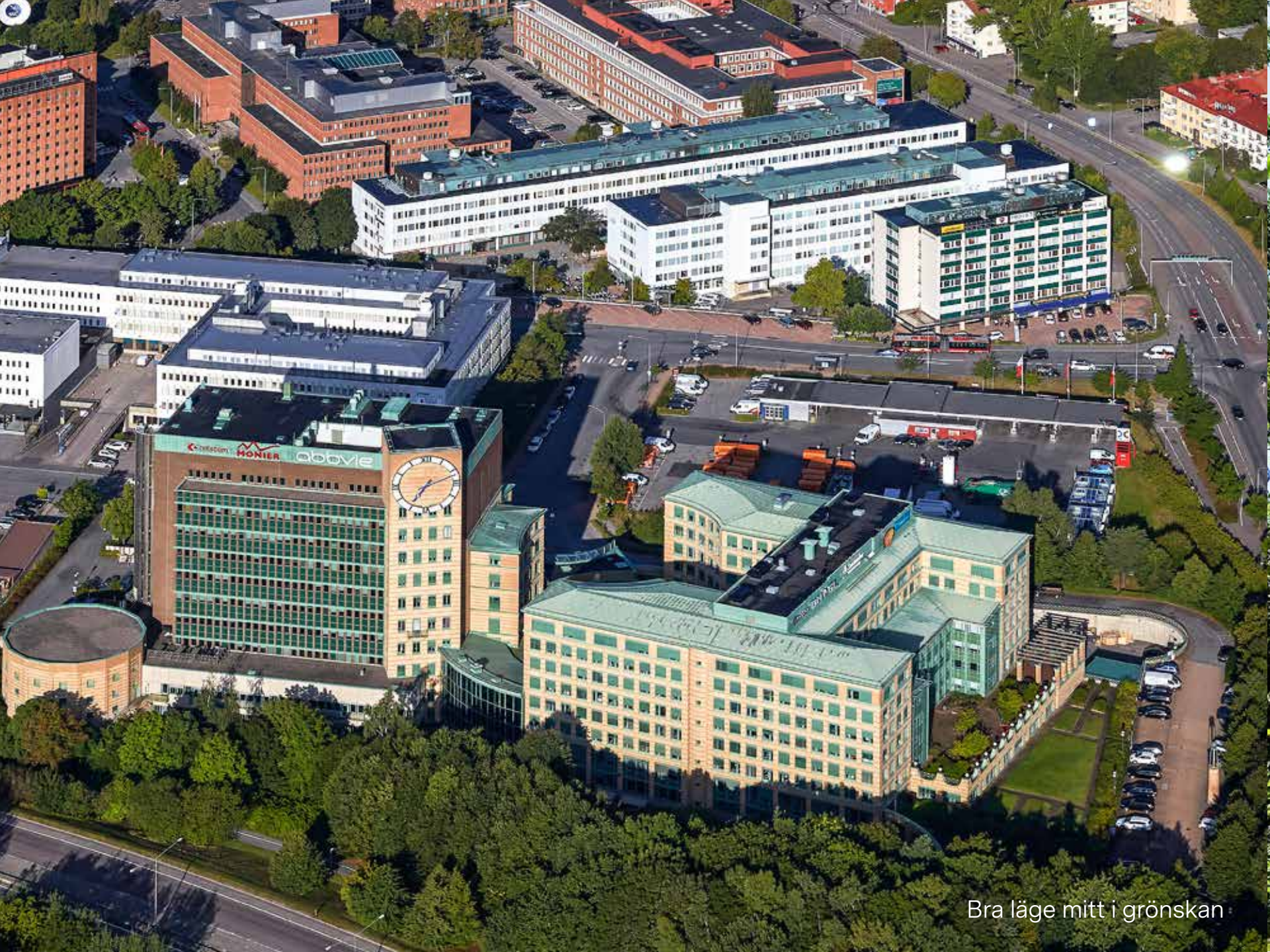
Bra läge mitt i grönskan