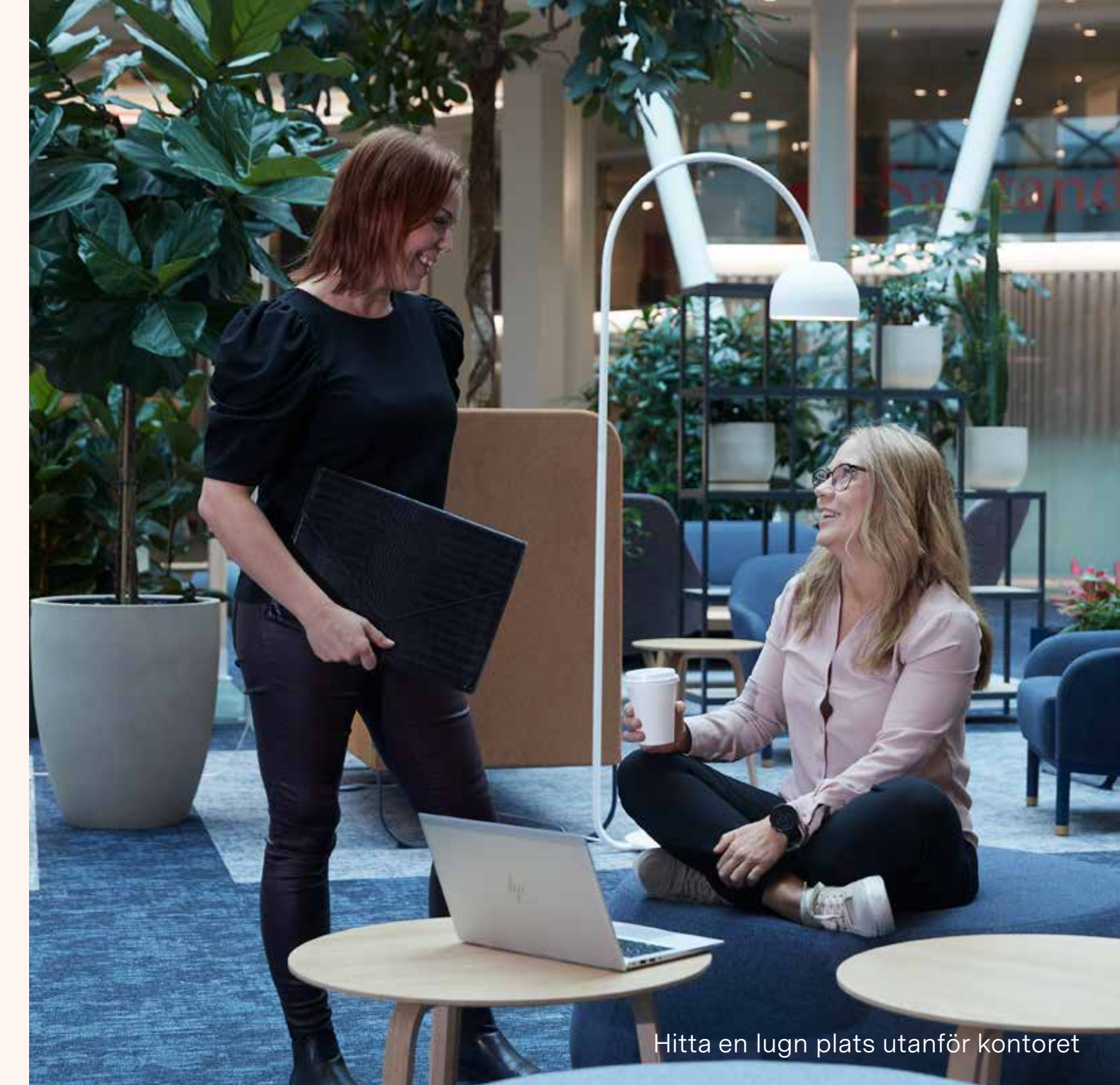
Hitta en lugn plats utanför kontoret

I det vackra och luftiga orangeriet finns ett 60-tal platser. Här får du känslan av att vara både ute och inne på samma gång. Takhöjd och fönstrena ut mot trädgården är helt fantastiska, här flödar ljuset bokstavligen in.