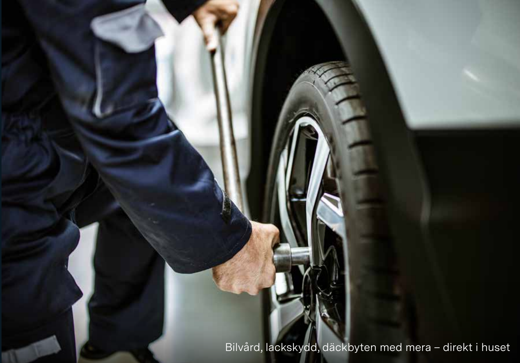
Bilvård, lackskydd, däckbyten med mera – direkt i huset

Här finns det gott om plats att parkera din cykel. Vi erbjuder både utomhusplatser och platser i garage, I garaget kan du att ladda batterier och har tillgång till enklare service.