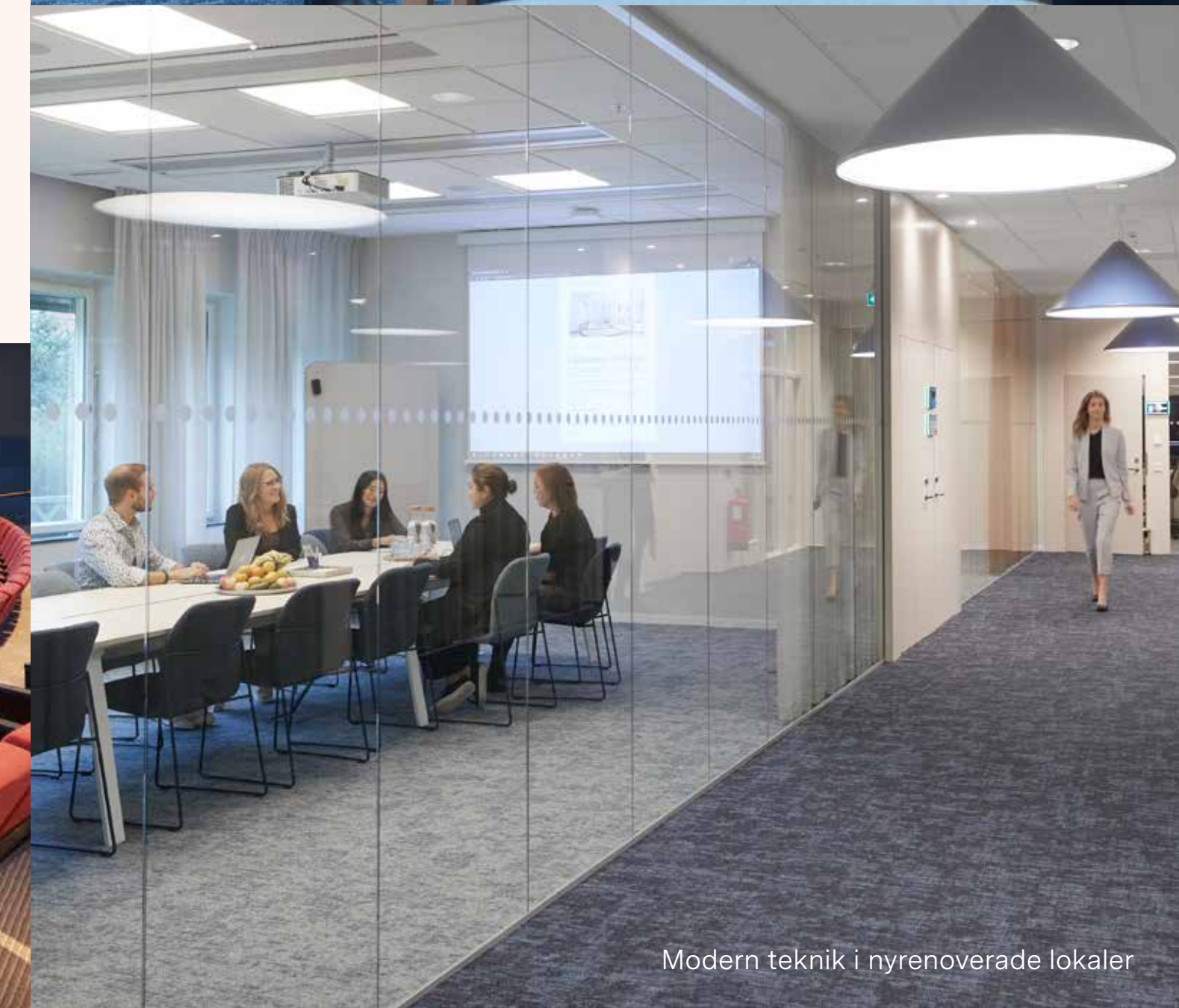
Modern teknik i nyrenoverade lokaler