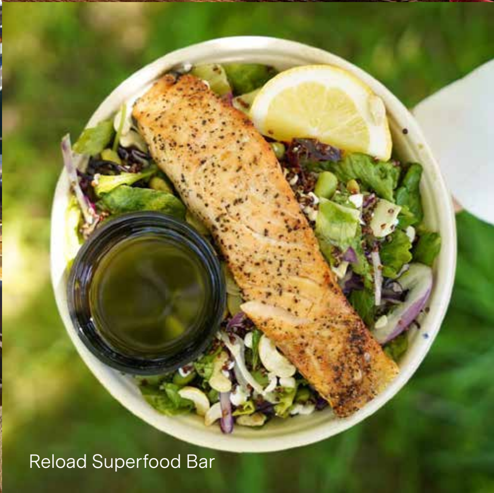
Reload Superfood Bar