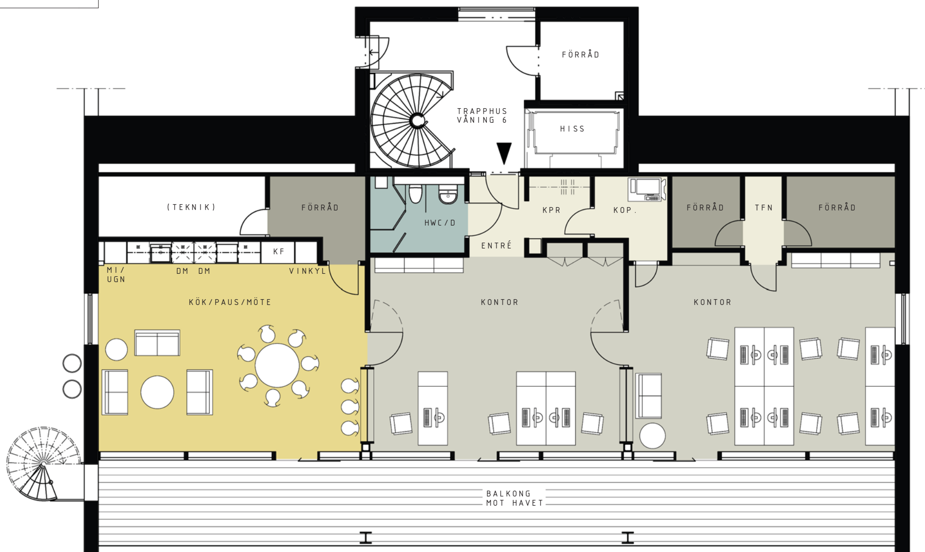
PLAN. VÅNING 6